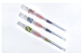
単回使用透析針(セーフタッチカニューラ)

ニプロは医療機器使用中の医療事故防止を目的に、製品設計上で実現可能な安全対策を取り入れています。