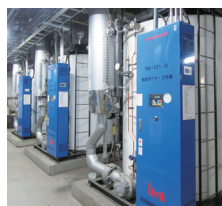
空調設備(フリージング)

ニプロでは、地球環境負荷を低減するため、各事業所において様々な取り組みを推進しています。一人一人が環境保全への取り組みを重要課題として、省資源活動・資源の再利用、電気・空調の省エネ・省工活動の推進など、地球環境に優しい活動を行っています。